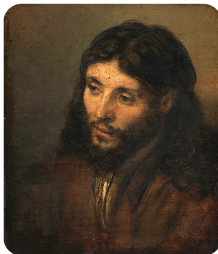
Cabeza de Cristo, Rembrandt, 1645-1650